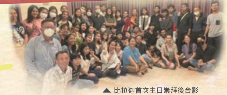
▲ 比拉迦首次主日崇拜後合影

我們的想法是，在原來宿舍附近，最好是在同一社區內，覓得一獨立屋，樓上作宿舍，樓下則為崇拜和團契聚會場所。所需經費預算約每月1000-1200美元。我們同心為此需要向主