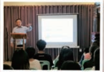
▲ 比拉迦主日崇拜證道

自從2020年新冠病毒肆虐全球以來，造成全球各個國家、地區陸續實行國境出入管控和各種通關出入境規定，這些條例規定除了限制人們活動，更大的隱憂還是害怕被染疫的風險，在此情況下，對工場的宣教士們也必帶來衝擊，不但須承受外在環境的挑戰，可能還有內心的牽掛及精神的種種隱憂。