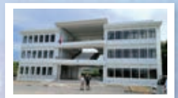
▲ 環球宣愛拜林中學